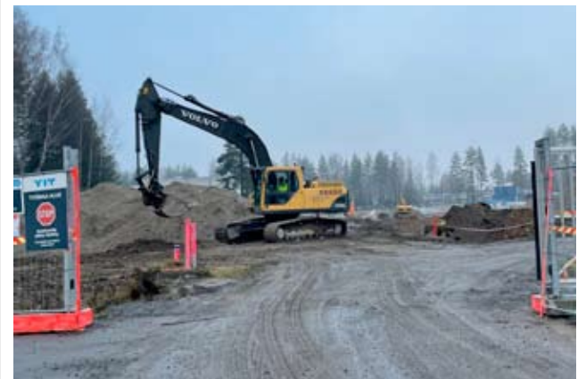
Uuden Otson yhtenäiskoulun rakennustyöt ovat käynnistyneet maansiirtotöillä.

Urakka käynnistyi kesällä entisen ammattikoulun purkutöillä. Itse koulu rakennetaan KVR-urakkana, joka tarkoittaa sitä, että pääurakoitsija huolehtii kokonaisuudessaan rakennuskohteen toteuttamisesta.