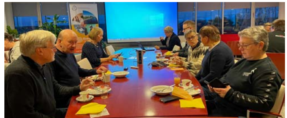
Yrittäjien aamupalalla Fasadissa puhuttiin omistajanvaihdoksista. Tämä on monessa yrityksessä Etelä-Pohjanmaalla ajankohtainen asia.