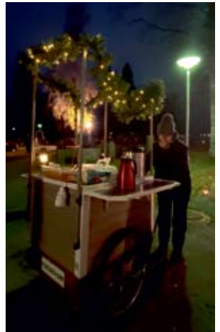
Alavuden seurakunta jakoi pyhäinpäivänä haudausmaalla liikkuneille glögiä ja piparia