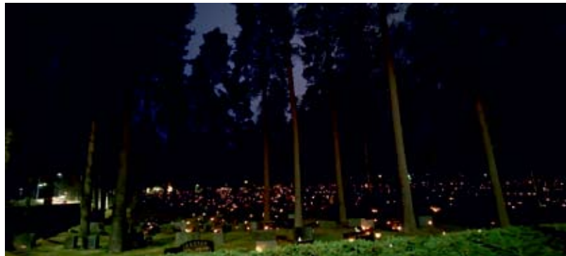
Kauniisti loistettu hautausmaa 5.11.2022

sen kirkon keskialjalta lähtien viettämästä juhlasta, jotka ovat kaikkien pyhien päivä ja kaikkien uskovien vainajien muistopäivä. Suomessa siitä on tullut yleinen vainajien muistopäivä.