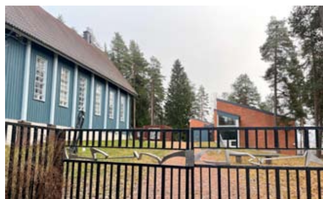
Pirkanpohjan portin ovet aukevat ensi vuonna 50-vuotisjuhluvuoteen.

Avajaiset koittavat torstaina 4.5. Juhlaseminaari pidetään perjantaina 19.5. Tuon taidekeskuksen 50-vuotisjuhlaseminaarin nimenä on Taiteen keskellä.