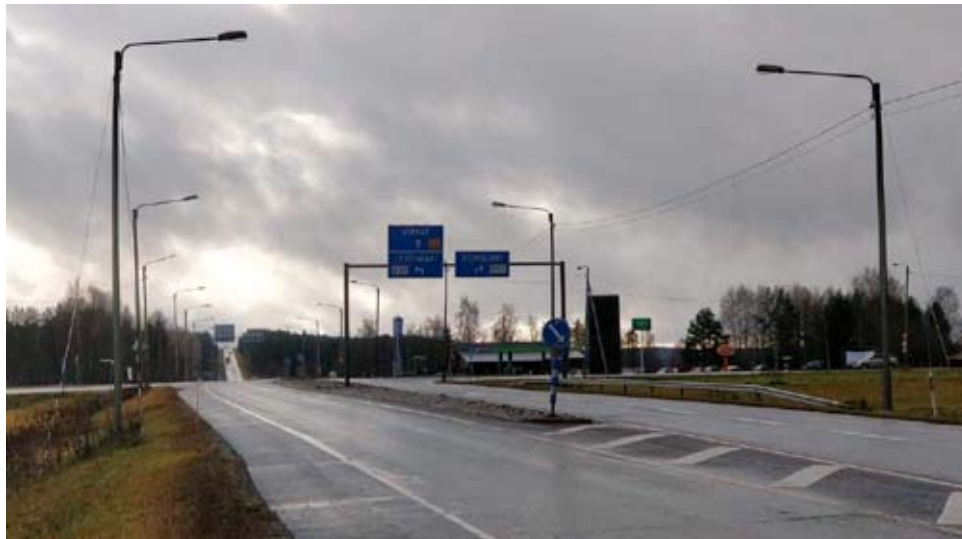
Kuortaneen kunnan mielestä Mäyrän kautta menevä valtatie 8 linjaus olisi paras vaihtoehto. Liikenne suuntautuu risteyksestä 4-5 suuntaan.

Mäyry on syöttöliikenteen kannalta risteysasema, josta liikenne suuntautuu 4-5 suuntaan: Seinäjoelle, Lehtimäelle/ Soiniin, Alavudelle sekä Lapualle/Alajärvelle. On tärkeää korostaa muun muassa Järvisseudun tien, maantie 711:n kautta avautuvaa ns. pohjoista ulottuvuutta, jota kautta liikennettä kulkee paljon etelä-pohjoisen-suunnassa ja jota esimerkiksi Järvisseudun teollisuus käyttää paljon kuljetuksissaan. Tien osalta on käynnistymässä näinä päivinä tiesuunnitel-