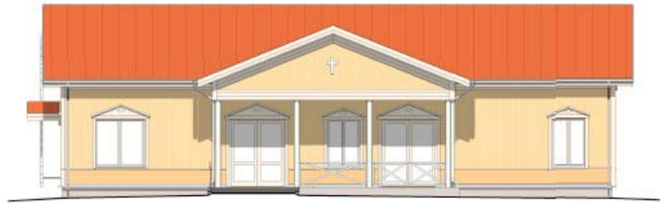
Töysän seurakuntakoti näyttää valmistuttuaan tältä, kun se on ensi syksynä valmiina.

Suunnitelmassa on, että rakennus on valmiina ensi syksynä.